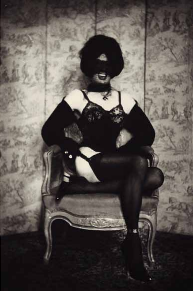
Pierre Molinier, Autoportrait, 1970-1.

benim işim değil görüşü hakimdir. Cinsiyetin ilerici bir görünümü de Navajo Hintlilerinde açığa çıkar; erkek ve kadın cinslerine ek olarak onlarda da üçüncü bir cins; Nadle 'ler vardır. Hem kadın hem de erkekler onlarla ilişkiye girebilir, çünkü Navajo'lar cinsiyet sorusundan bağımsız olarak cinsel tercihlerini yaparlar.