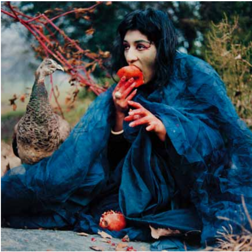
Jack Smith, Untitled, c.1958-1962