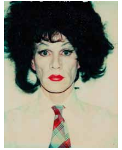
Man Ray, Rose Sélavy (Marcel Duchamp), 1923, Andy Warhol, Self Portrait in Drag, 1981-82.