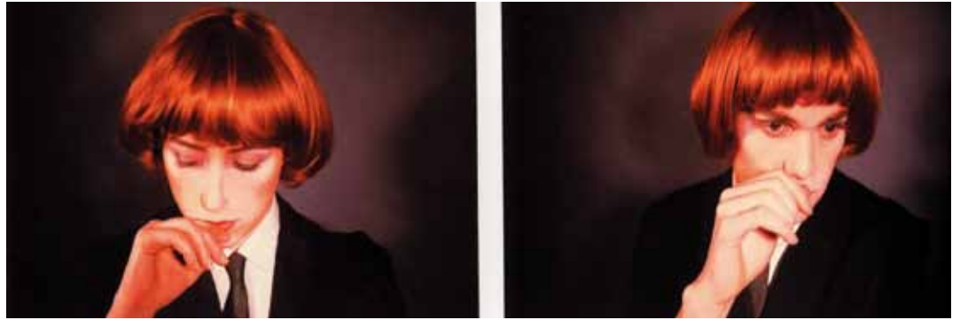
Cindy Sherman as Richard Prince, Richard Prince as Cindy Sherman, 1980.