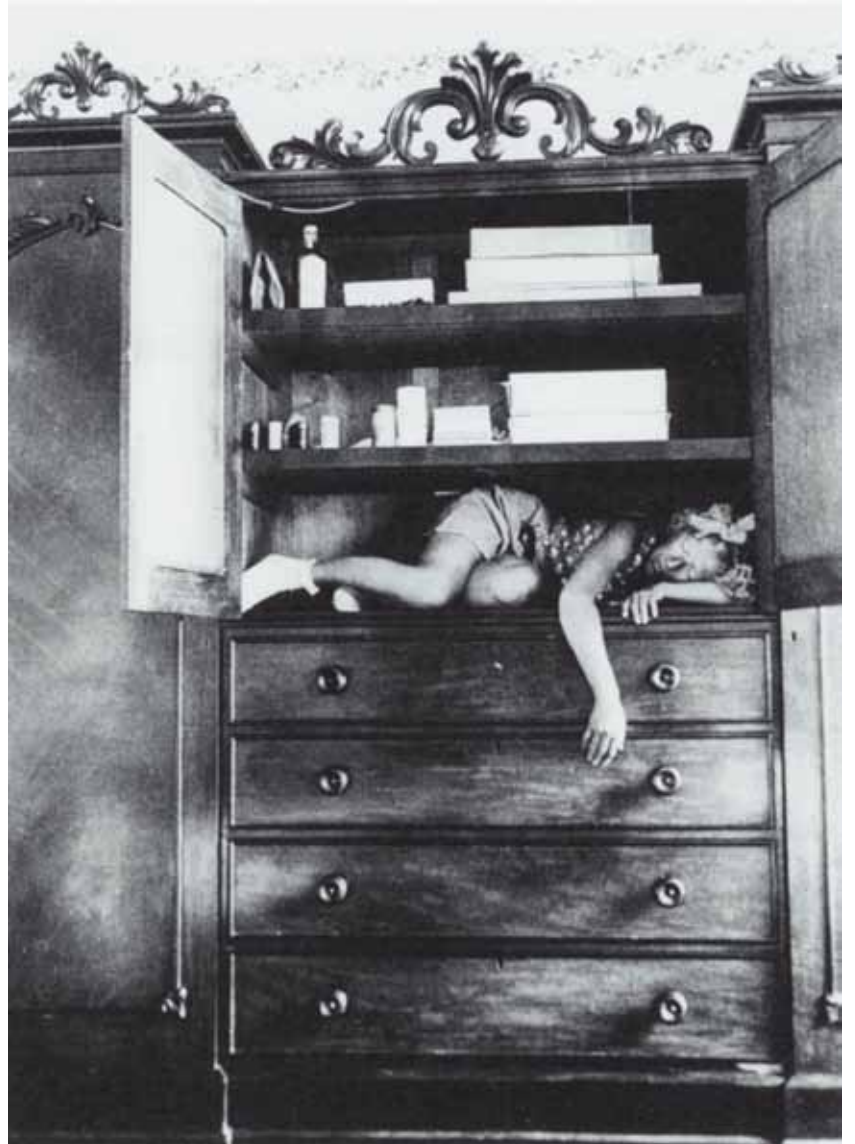
Claude Cahun, Self Portrait, 1932.