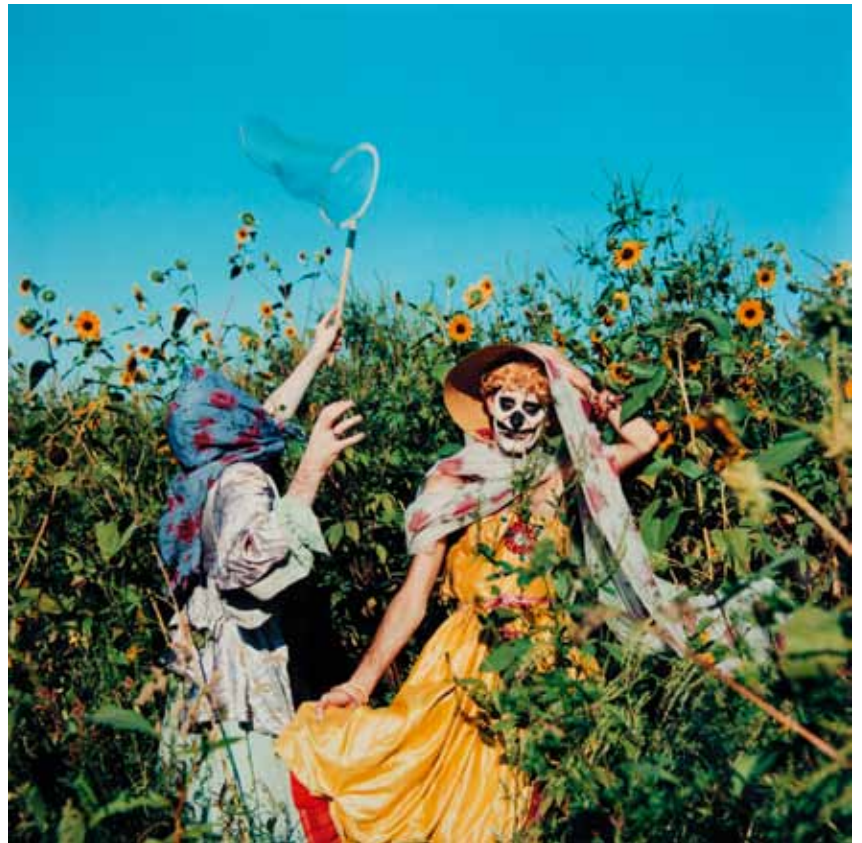
Jack Smith, Untitled, c.1958-1962