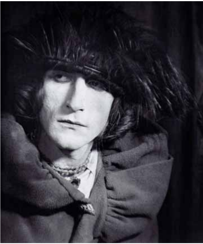
Man Ray, Rose Sélavy - Autoportrait, 1921.