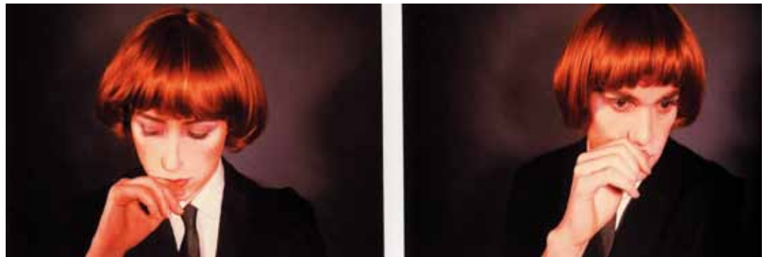
Cindy Sherman as Richard Prince, Richard Prince as Cindy Sherman, 1980.