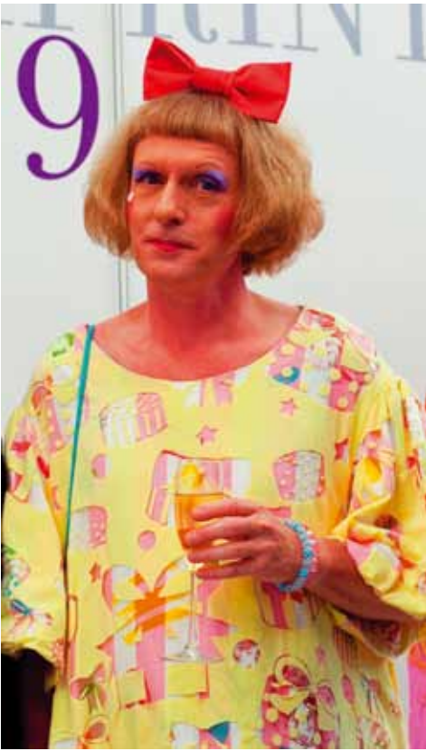
Grayson Perry in Drag, Serpentine Gallery, 2011.