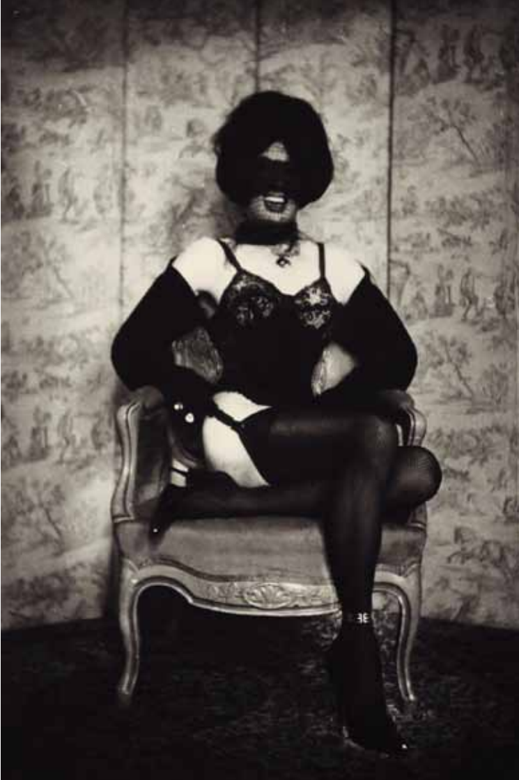
Pierre Molinier, Autoportrait, 1970-1.

benim işim değil görüşü hakimdir. Cinsiyetin ilerici bir görünümü de Navajo Hintlilerinde açığa çıkar; erkek ve kadın cinslerine ek olarak onlarda da üçüncü bir cins; Nadle 'ler vardır. Hem kadın hem de erkekler onlarla ilişkiye girebilir, çünkü Navajo'lar cinsiyet sorusundan bağımsız olarak cinsel tercihlerini yaparlar.