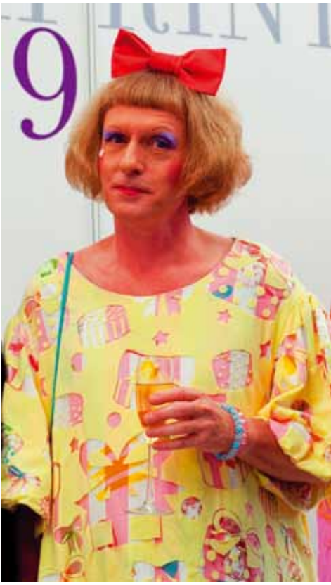
Grayson Perry in Drag, Serpentine Gallery, 2011.