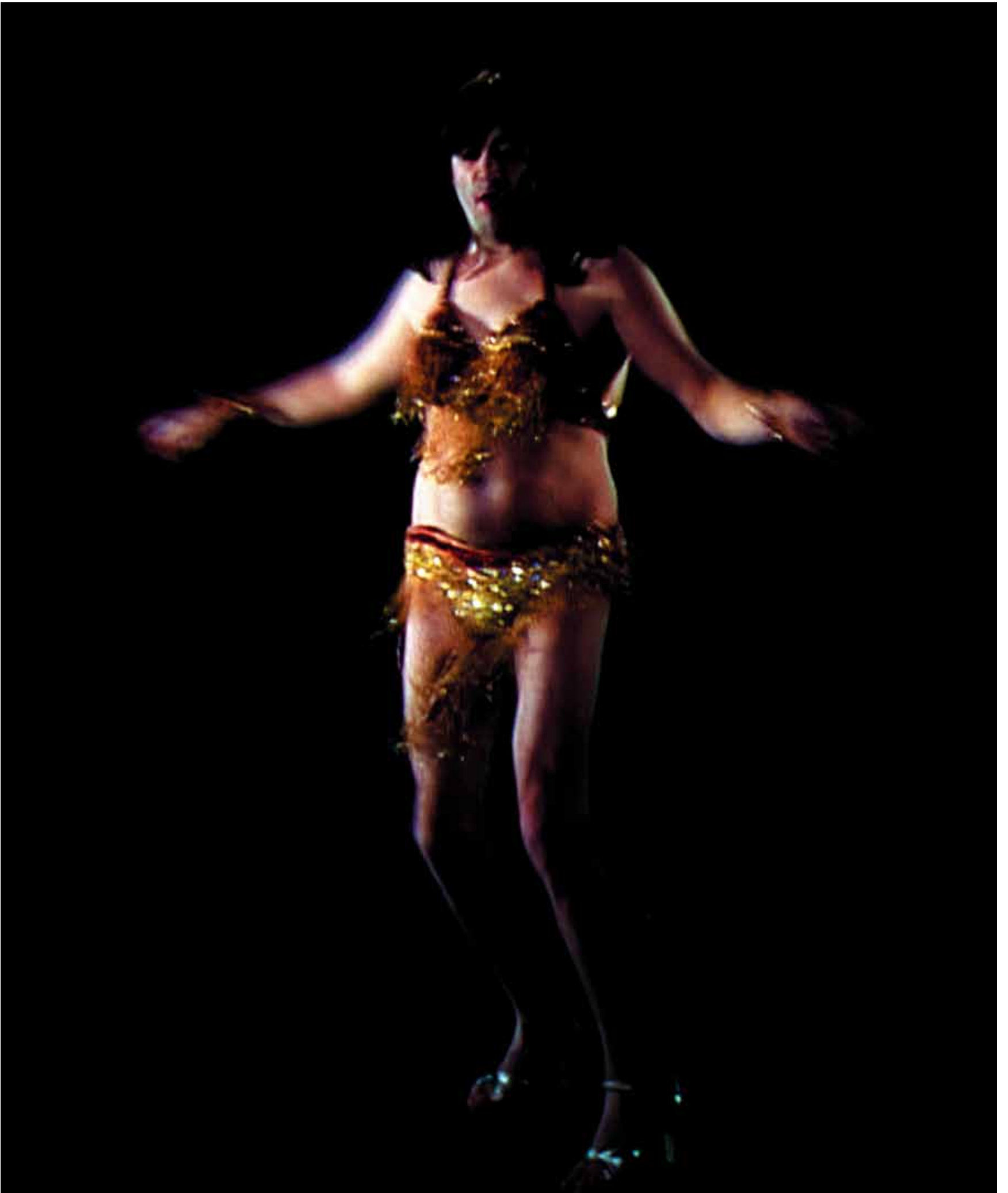
Kutluğ Ataman, Türk Lokumu, 2007, Kutluğ Ataman ve Thomas Dane Gallery, Londra'nın izniyle, Yapımcı: Saatleri Ayarlama Enstitüsü, İstanbul, Enstalasyon görüntüsü: İstanbul Modern, 2010.