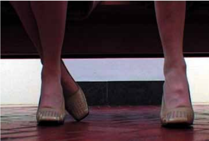
Brice Dellsperger, Body Double 15, 2001, Courtesy Galerie Air de Paris.